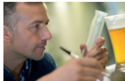
Verres de dégustation